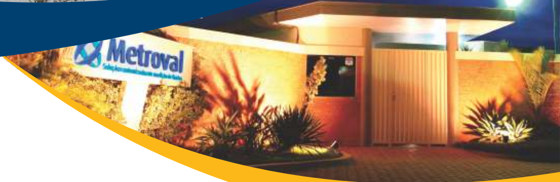
FILIAL MACAÉ - RJ