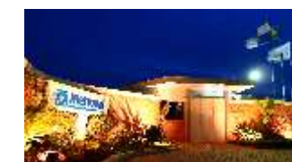
Filial - Macaé/RJ