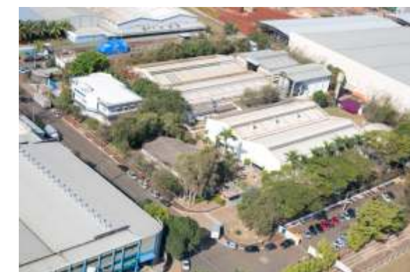
Matriz - Nova Odessa/SP

Com mais de três décadas de experiência, hoje a Metroval se orgulha de contabilizar mais de 30.000 medidores comercializados para mais de 6.000 clientes. Uma empresa genuinamente brasileira e líder nacional na tecnologia da medição, domina completamente o ciclo de produção de medidores e sistemas de medição de vazão, gerando o desenvolvimento contínuo de soluções em controle de fluidos.