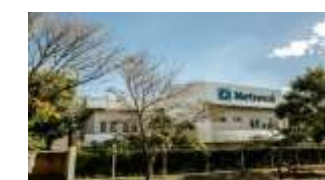
Matriz - Nova Odessa/SP